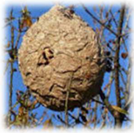
Nid de frelons asiatiques