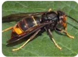
frelon asiatique (taille 3cm)