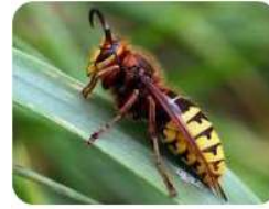
frelon européen (taille 4 cm)